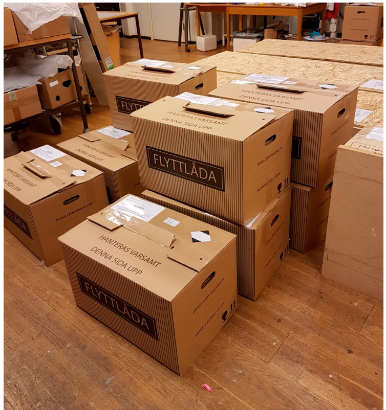
Fig. 1 och 2. Materialet förbereds för transporten från museet till Studio Västsvensk Konservering (SVK). The material is prepared to be transported to Studio Västsvensk Konservering (SVK).